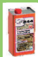
HMK S244 Avec renforcement de couleur, Antitaches - couleur plus

Rendement du produit de protection : env. 5-20 m 2 /litre