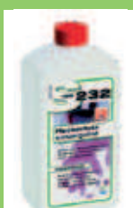
HMK S232 Sans renforcement de couleur antitaches, base aqueuse