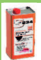
HMK S234 Léger renforcement de couleur, Antitaches - extra